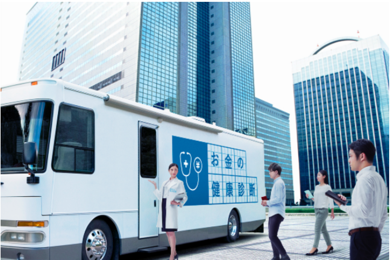
「お金の健康診断」診察トラックイメージ